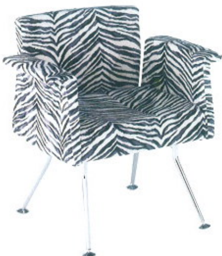
Airon, da Sitting ( www.sittingsnc.it )