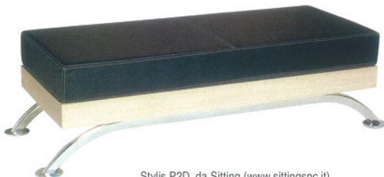
Stylis P2D, da Sitting ( www.sittingsnc.it )