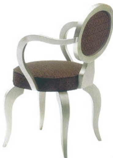
K321, da Klass ( www.klass.it )