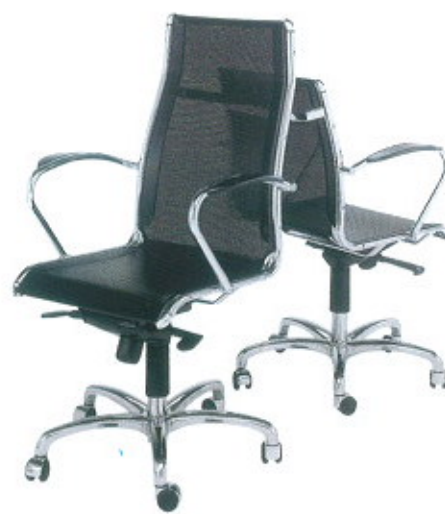
Brio A, da Sitting ( www.sittingsnc.it )