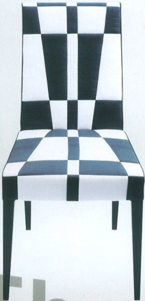
Valentina Chair, da L'abbate ( www.lacollection.it )

A Promosedia - International Chair Exhibition comemorou, em Setembro, 30 anos de existência. Sente-se e veja aqui o resumo.