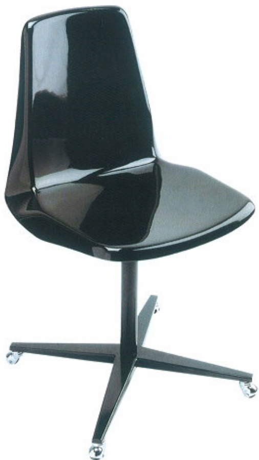
Flora, da L'abbate ( www.lacollection.it )