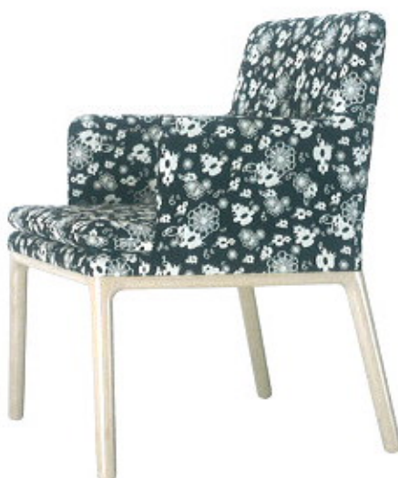
Allround Arm, da Sedie Friuli ( www.sediefriuli.it )