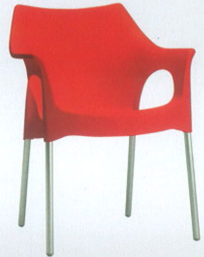
Ola, da Scab ( www.scabitaly.com )