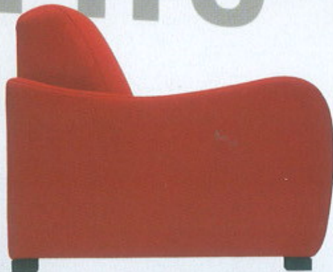
George K, da Sedie Friuli ( www.sediefriuli.it )