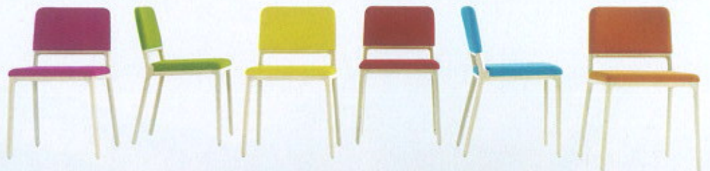
Allround Chair, da Sedie Friuli ( www.sediefriuli.it )

É a exposição mais importante da região autónoma de Friuli Venezia Giulia e um bom exemplo do melhor que é feito em Itália. Uma mostra voltada para o exterior, num formato pequeno mas suficientemente adequado aos seus objectivos. Não são os metros quadrados de feira ou a internacionalização dos produtos nela representados que a destacam, pelo contrário, é a promoção das empresas da região, com um enfoque muito especial na qualidade, e a divulgação