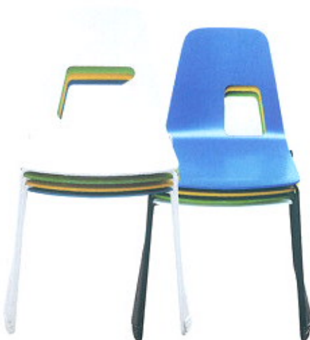
Hole Collection, da L'abbate ( www.lacollection.it )