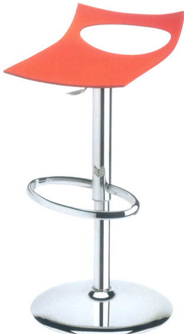
Diavoletto, da Scab ( www.scabitaly.com )