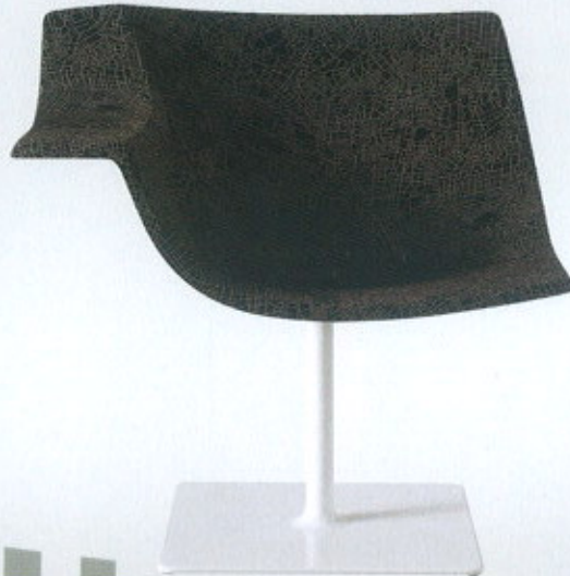
Bonanza Easy, da L'abbate ( www.lacollection.it )