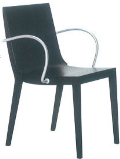
Moka, da Sedie Friuli ( www.sediefriuli.it )